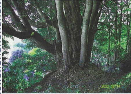
【参考までに】 八王子みなみ野駅南側にあり、宇津毘沙門天のスダジイ(市の天然記念物)は樹齢約三百年、樹高二十mです。

とされます。しかし現在は私有地の中にあるこの一本しか残っていません。何らかの市の保護が待たれます。 中郷日光神社の「スダジイ」 中郷の日光神社は家康を祀るために井上出羽が建立した神社です。その崖の上に神社を守るかのように植えられたスダジイ(ブナ科)がどっしりと茂っていました。根廻は太く、5〜6mあります。根元が浸食され、一部露出しています。早急に保護が必要かと思っています。