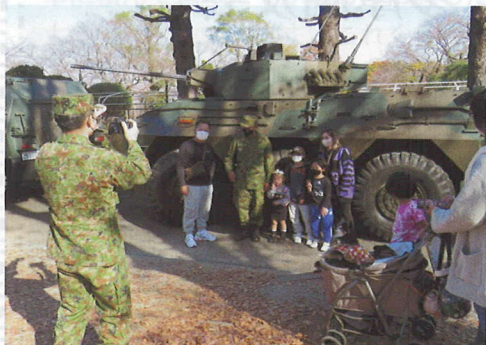
いちよう祭りで見かけた自衛隊の高射砲