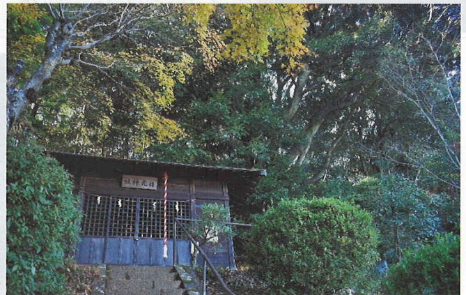
家康を祀る中郷の日光神社