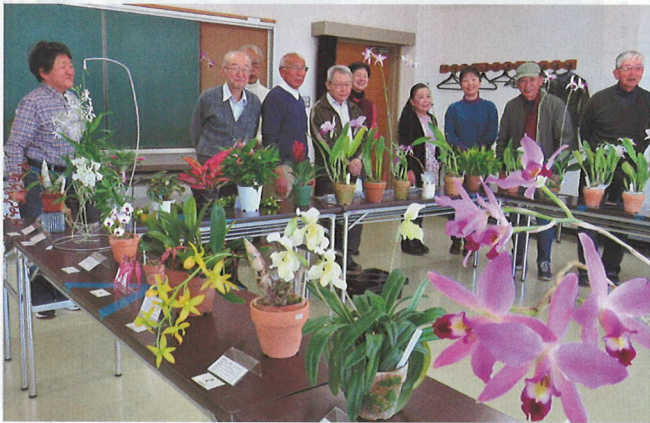
自作の蘭(ラン)を前に「多摩蘭友会」の皆さん

長房地域住民協議会 八王子市長房町506-2 八王子市長房市民センター ☎042(664)4774 (公財)八王子市学園都市 文化ふれあい財団