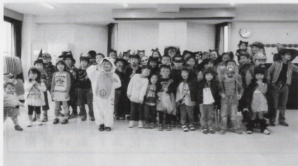
ハロウィンの仮装をした子どもたち

新会員を迎えての最初の行事は、一昨年から体育館で鬼ごっこを行っています。景品やMVP賞を用意し、大人も子どもも白熱し盛り上がりま