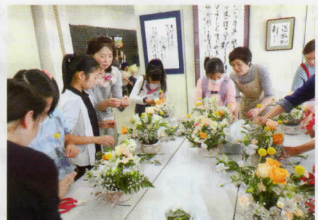
人気のフラワーアレンジメント