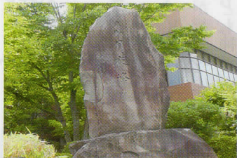
共立女子学園内の月夜峰の石碑