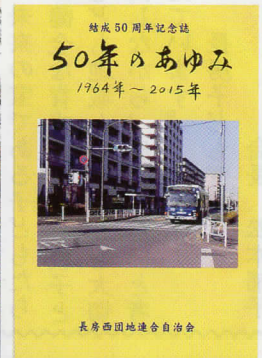
長房西団地連合自治会 結成50年記念誌『50年 のあゆみ』を刊行