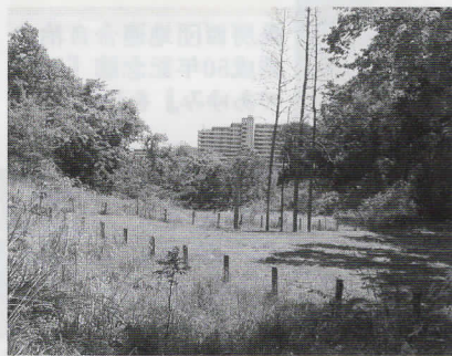
曲輪の跡と思われる地形

氏照は神楽が好きで宴には獅子舞が催され、家臣篠村佐近之助の姫「安寧」と狭間郷士の息子で笛の名人が月夜峰で恋に落ちたそうです。高尾の熊野神社には樫の木と樺が相生した古木があり、この二人が民話になっています。八王子城落城後は氏照の室「お比佐」の方がこの地で侍女数名とわびしい余生を送ったと言われています。左(北方)に曲がり尾根に出ると、大岳山をはじめ奥武蔵の山々など眺望絶景です。中央高速を渡ると「滝不動」があります。三軒在家、船田、月夜峰を通る鎌倉古道の「不動坂」になります。氏照の構想、八王子城郭は御主殿の曳き橋から幅8mの道路を造り、中心街の元八王子に繋げ、落越には家老職の屋敷(大名屋敷)、船田には庶民の街が造られようとしておりましたが、天正18年(1590)秀吉軍の前田勢が月夜峰を通り八王子城御主殿を攻め、松竹から上杉勢に攻められ、落城し、氏照は小田原で切腹し夢が絶たれました。