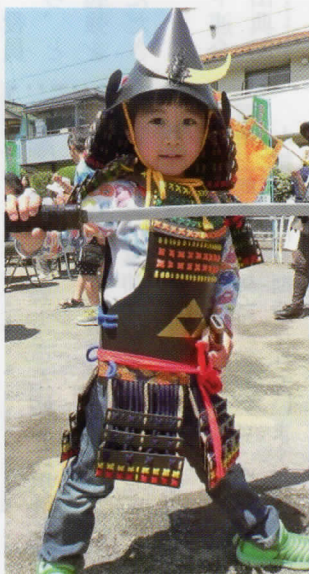
よろいの紋所は北条氏照