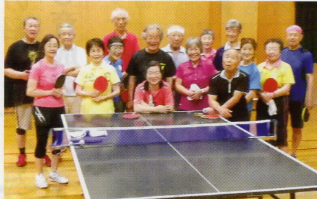
卓球クラブ「ピンキチ」