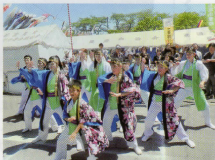
じょいそーらん四季舞