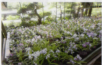
趣味のウチョウラン栽培