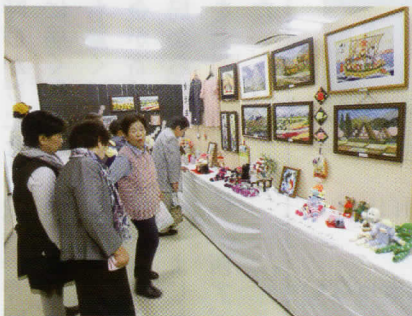
趣味の工芸品なども展示