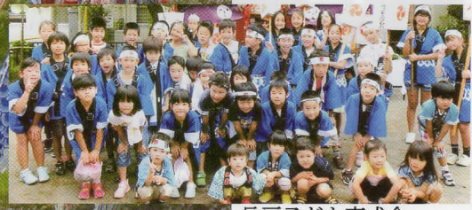
長房子ども育成会