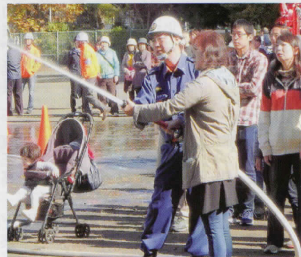
◎町自連横山北地区、合同防災訓練