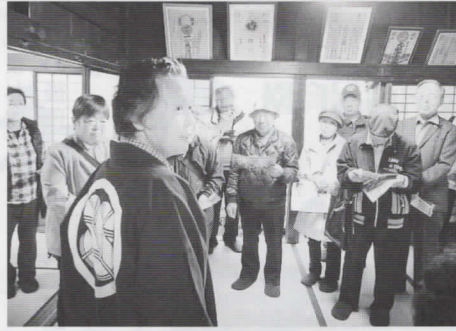
富士吉田市「御師」の宿、外川家で

11月14日(月)、市民センターの休館日に、住民協議会と職員の親睦を兼ね、富士吉