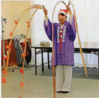
◎南団地、サロン「光」でのマジックショー