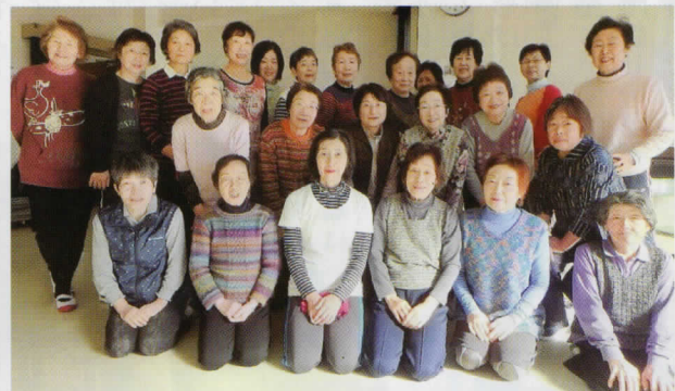
◎トリム体操「山百合体操クラブ」のみなさん