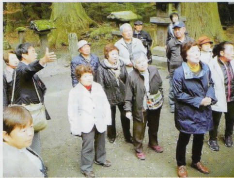
◎富士吉田、河口湖への研修バス旅行