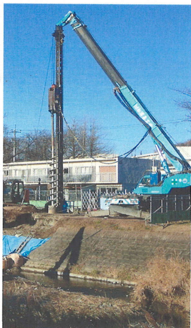
長房町側の支点部分の掘削