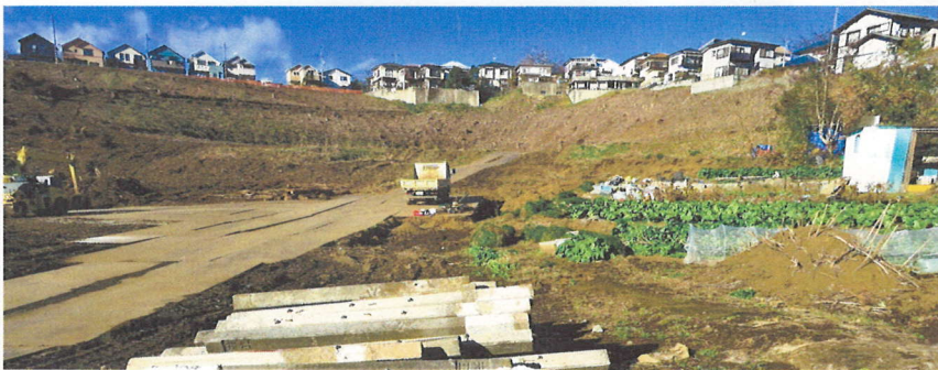
183区画の大型開発現場、船田