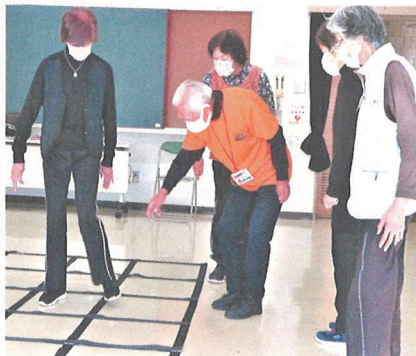
けやき会の「ふまねっと運動」