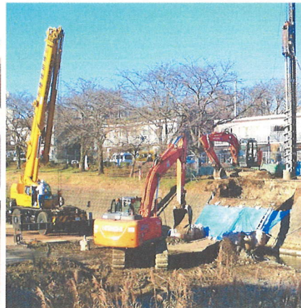
陸橋の架け替え工事始まる