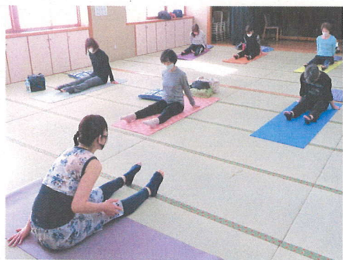
ストレッチ ヨガのレッスン