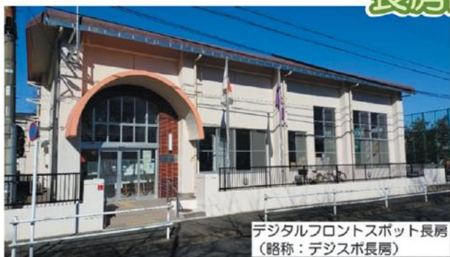
デジタルフロントスポット長房 (略称：デジスポ長房)