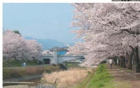
五月橋から陵南公園へかけての浅川沿いは 両岸に桜が咲きほころお花見の定番お散歩コースです