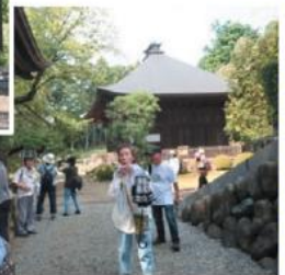
廣園寺の境内もみなさんで散策しました