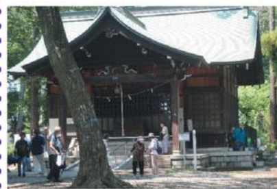
富士森公園内の小山の上にある浅間神社