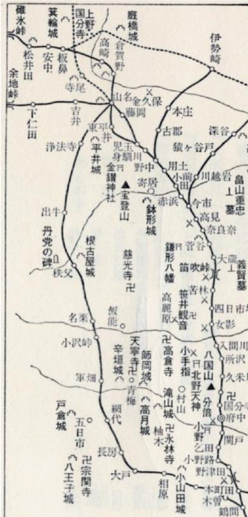
栗原仲道著「鎌倉街道概念図」山の道(左側一部分)

梶原八幡神社の付近は慈根寺(じごじ)と呼ばれた地名で長房の船田にかけて庶民の街(城下町)でした。いずれも住宅街を通りますが建物に沿った直線ではなく曲っています。また江戸時代以前の古道は川を渡るときを除いて、丘陵や山の中腹など高台を歩いています。山の尾根や川沿いの平坦な土地は避けています。そしてランドマークの北方面には大岳山(キューピー山)、南の方角は丹沢大山がよく見える場所にできました。古代から人々が往来した長房の古道を散策しては、いかがでしょうか。